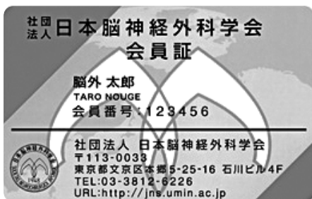
（一社）日本脳神経外科学会 会員証

学会参加期間中は、毎日、来場時（学会場にきた時）および退場時（学会場から帰る時）に領域講習受付を「下記」会員証（ICカード）で行ってください。